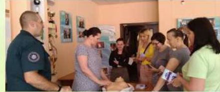
По материалам Телеграм-канала

Воспитание детей в русле ответственности за собственную безопасность и безопасность окружающих, формирование представления реальности проблемы – это постоянный процесс, в котором обязательно должны участвовать взрослые. Тогда жизнь детей будет в безопасности.